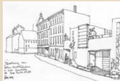
Die Entstehung des Stadthausstandortes Roßmarktstraße