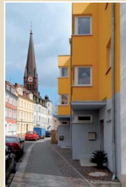
Stadthäuser in der Roßmarktstraße