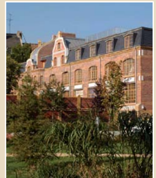
Wohneinheiten in der Lützner Straße 77 – 79