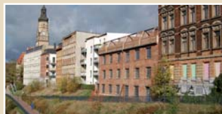
Selbstgenutztes Wohneigentum am Karl-Heine-Kanal