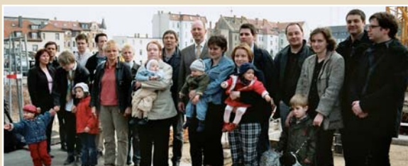
Grundsteinlegung für die Stadthäuser in der Industriestraße mit dem ehemaligen Oberbürgermeister Wolfgang Tiefensee

+++ ca. 600 Beratungen zur Eigentumsbildung +++ Veräußerung von 64 Wohneinheiten (42 Alt- und 22 Neubau) +++ Entwicklung von 7 Stadthausstandorten auf innerstädtischen Brachflächen