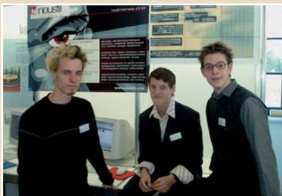
Die Schülerfirma neustil intermedia präsentiert sich auf den Gründertagen.

Das Projekt Jugend im Unternehmertum besteht aus verschiedenen Bausteinen mit folgenden wesentlichen Inhalten: