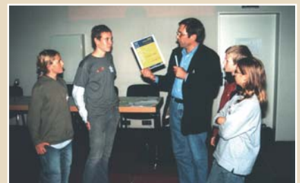
Auszeichnung des NaSch-Cafés während einer URBA n-Veranstaltung